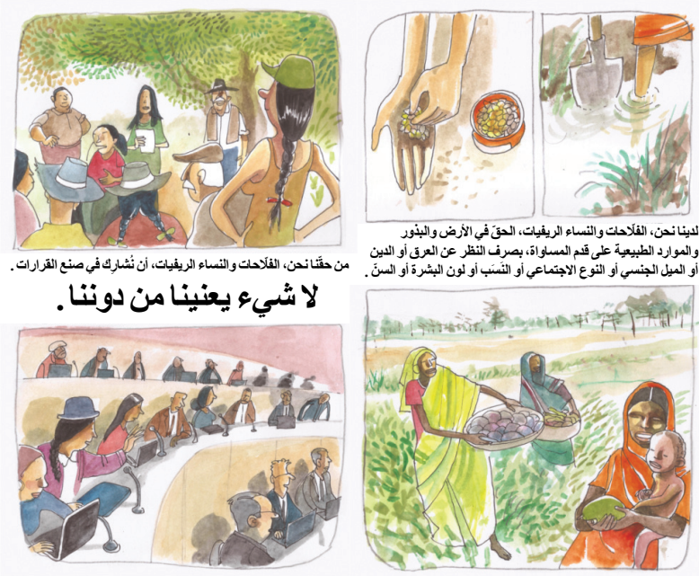
لدينا نحن، الفلاحات والنساء الريفيات، الحق في الأرض والبيوت والموارد الطبيعية على قدم المساواة، بصرف النظر عن العرق أو الدين أو الميل الجنسي أو النوع الاجتماعي أو التسبب أو لون البشرة أو السن.